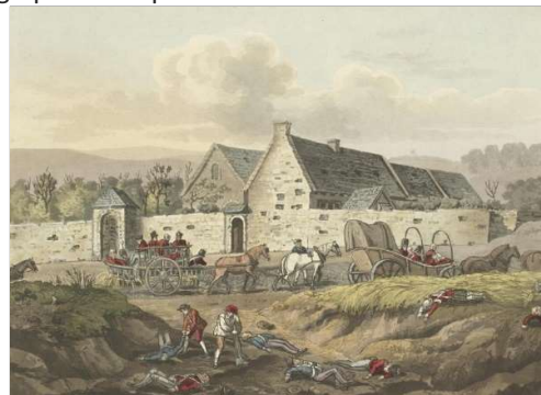
Deze afbeeldingen tonen hoe omwonenden de lichamen van dode soldaten begraven en/of ophalen

Het Duitstalige Prager Tagblatt schreef in 1879 zelfs dat het beter was honing te gebruiken dan suiker, om te voorkomen, dat je de atomen van je overgrootvader in je koffie deed. De boeren rond Waterloo moeten destijds ook accidenteel op menselijke botten gestoten zijn. Omdat het land diep moest worden omgeploegd voor de bietenteelt. En het is niet zo gek dat ze die beenderen verkochten, als je bedenkt hoeveel ermee te verdienen viel. In een tijd waarin een kilo brood 25 cent kostte, leverden die beenderen honderdduizenden franken op. Veel meer dan een boer normaal in zijn hele leven verdiende.