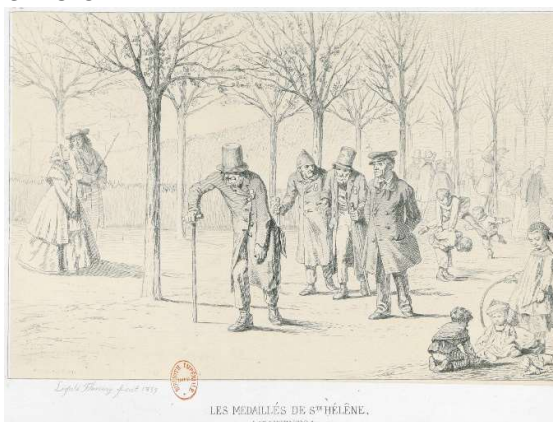
In 1857 waren de veteranen allemaal al oude mannen toen ze hun decoratie ontvingen