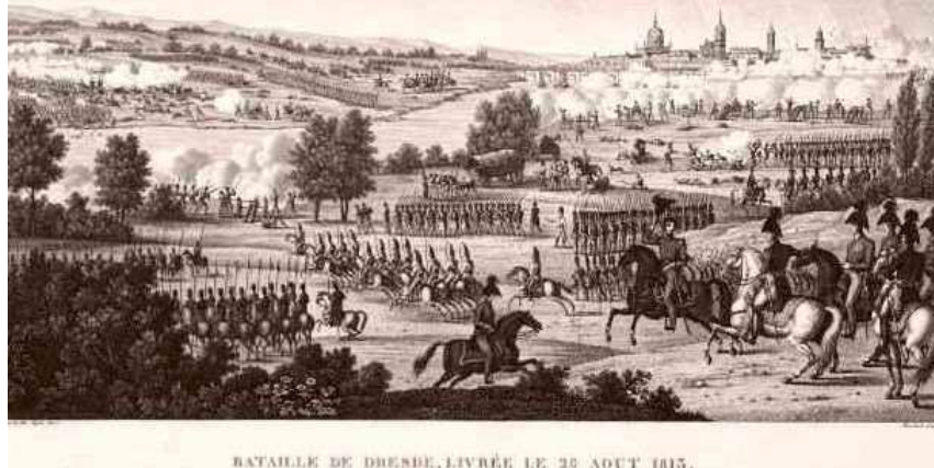
BATAILLE DE DRESDEN, LIVRÉE LE 26 AOUT 1813.

(3) De voltigeur was een lichte infanterist, eerder klein van gestalte en een goede schutter. De voltigeurs werden toegevoegd aan de bataljons infanterie van linie, en ingezet om voor de linie te avanceren en de bevelvoerders