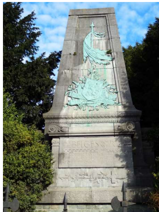
Het monument voor de Belgen te Waterloo

Er staat een monument ter ere van de Belgen die deelnamen aan de Slag van Waterloo aan het kruispunt van de Chaussée de Charleroi en de Rue du Dimont.