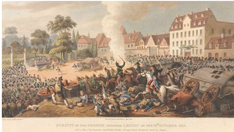
PURSUIT OF THE FRENCH THROUGH LEIPZIG ON THE 16 TH OCTOBER 1813.

(4) De Slag om Leipzig had plaats tussen 16 en 19 oktober 1813, was één van de belangrijkste gevechten tijdens de Napoleontische oorlogen. Het leger van Napoleon werd er verslagen en diende zich terug te trekken.